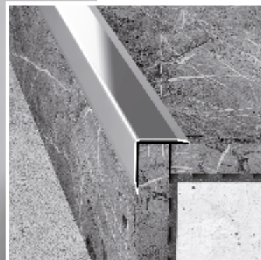
Profile ze stali nierdzewnej